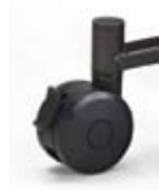
キャスターレッグ