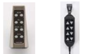
ワイヤレス ワイヤード

● 脚部は購入時に固定レッグ仕様かキャスター仕様が選べます (SC/2M/3M どちらのタイプでも可能)